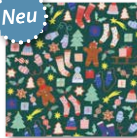
Dessin: St 980-924248 50 cm x 250 m: 87,40 € weiss Kraft ungestreift, 70g/m 2