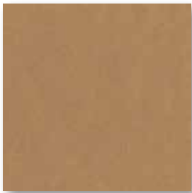
Dessin: J 252-0791- 50 cm x ca. 10 kg: 31,90 € 75 cm x ca. 15 kg: 47,85 € braun Natronkraft, 70g/m 2