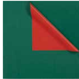
Dessin: Z 3500 50 cm x 250 m: 79,80 € 70 cm x 250 m: 110,30 € weiss Kraft enggerippt, 60g/m 2