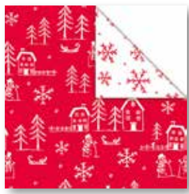
Dessin: St 980-36166 50 cm x 250 m: 87,40 € weiss gestrichen, 80g/m 2