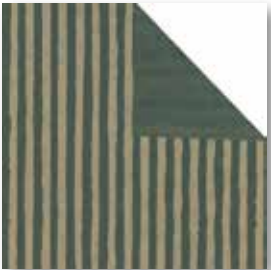
Dessin: J 157-009 50 cm x 250 m: 56,50 € braun Kraft enggerippt, 50g/m 2