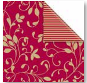
Dessin: St 980-979791 50 cm x 250 m: 113,20 € weiss gestrichen, 80g/m 2