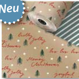
Dessin: St 980-924228 50 cm x 250 m: 113,20 € hochweiss gestrichen, 80g/m 2