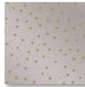
Dessin: St 980-923239 50 cm x 250 m: 87,40 € weiss Kraft ungestreift, 70g/m 2

Abweichungen in Farbe und Motiv sind möglich. Falls Ihr Wunschmotiv nicht dabei ist, haben wir über 300 Motive in weiteren Katalogen zur Auswahl!