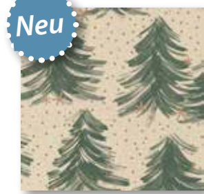
Dessin: Z 980-924204 50 cm x 150 m: 74,50 € Zuckerrohrpapier, 70g/m 2