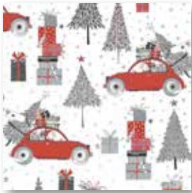
Dessin: St 980-921228 50 cm x 250 m: 87,40 € hochweiss gestrichen, 80g/m 2