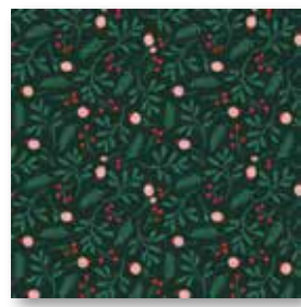
Dessin: St 980-922224 50 cm x 250 m: 87,40 € weiss Kraft ungestreift, 70g/m 2