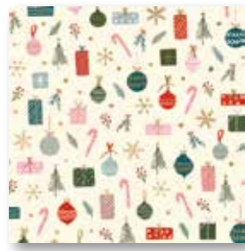
Dessin: St 923227 30 cm x 250 m: 61,20 € 50 cm x 250 m: 87,40 € hochweiss gestrichen, 80g/m 2