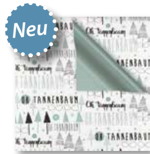
Dessin: Z 980-4A03141 50 cm x 250 m: 79,80 € weiss gestrichen, 80g/m 2