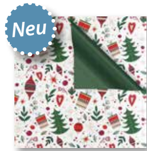
Dessin: Z 980-4A05741 50 cm x 250 m: 79,80 € weiss gestrichen, 80g/m 2