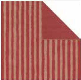
Dessin: J 157-008 50 cm x 250 m: 56,50 € braun Kraft enggerippt, 50g/m 2