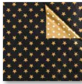
Dessin: Z 980-5A5834 50 cm x 250 m: 79,80 € weiss gestrichen, 80g/m 2