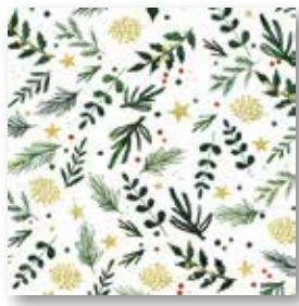
Dessin: Z 980-2393721 50 cm x 250 m: 79,80 € weiss Kraft gestreift, 60g/m 2