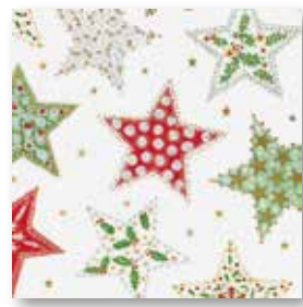
Dessin: St 980-916240 50 cm x 250 m: 87,40 € hochweiss gestrichen, 80g/m 2