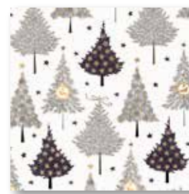
Dessin: St 980-922229 50 cm x 250 m: 87,40 € hochweiss gestrichen, 80g/m 2