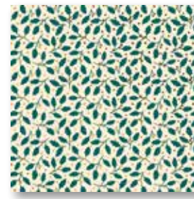
Dessin: St 980-922222 50 cm x 250 m: 87,40 € weiss gestrichen, 80g/m 2