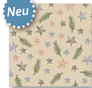
Dessin: St 980-924205 50 cm x 150 m: 74,50 € Zuckerrohrpapier, 70g/m 2