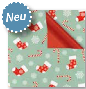
Dessin: Z 980-4A02411 50 cm x 250 m: 79,80 € weiss gestrichen, 80g/m 2