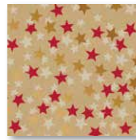
Dessin: St 980-917276 50 cm x 250 m: 87,40 € br. Recycling ungestreift, 70g/m 2