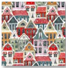
Dessin: St 980-920244 50 cm x 250 m: 87,40 € weiss Kraft ungestreift, 70g/m 2