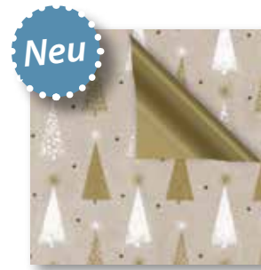
Dessin: Z 980-4A06641 50 cm x 250 m: 79,80 € weiss gestrichen, 80g/m 2