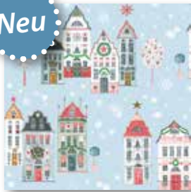
Dessin: St 980-924234 50 cm x 250 m: 87,40 € hochweiss gestrichen, 80g/m 2