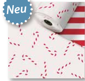
Dessin: St 980-924226 50 cm x 250 m: 113,20 € hochweiss gestrichen, 80g/m 2