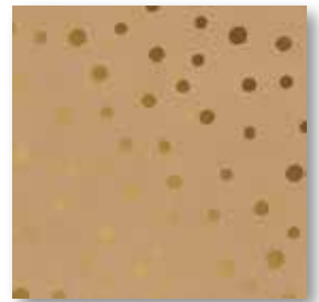
Dessin: ST 254-923044 50 cm x 150 m: 57,80 € br. Recycling ungestreift, 70g/m 2