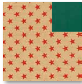
Dessin: Z 980-1975022 50 cm x 250 m: 79,80 € br. Recycling gestreift, 60g/m 2