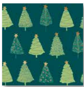
Dessin: St 980-919216 50 cm x 250 m: 87,40 € weiss Kraft ungestreift, 70g/m 2